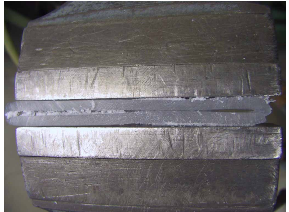
Gehäusetasse bricht selbst beim Test im Schraubstock nicht, sondern verformt sich nur.