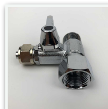
T-Stück Anschlussadapter für Kaltwasseranschluss