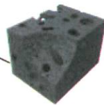
Gesintertes Aktivkohle- block von carbonit ® (Porengröße 2,5 µm)

Belastungen durch im Wasser gelöste organische Schadstoffe, Geruchs- und Geschmacksbeeinträchtigungen werden überwiegend durch die Aktivkohle entnommen.